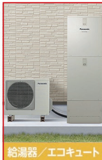
給湯器/エコキュート